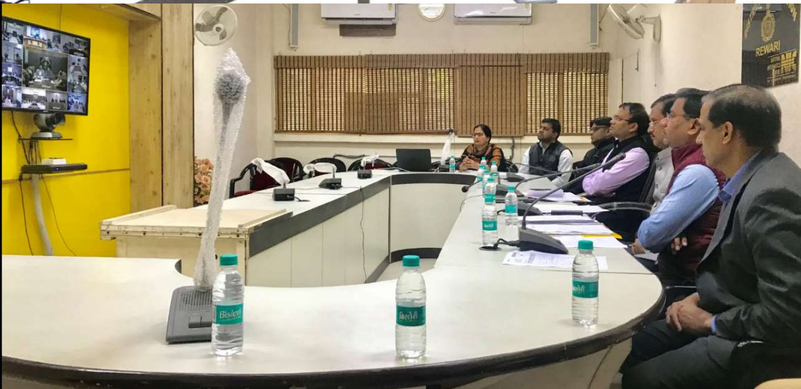
Meeting with DC, Rewari and Civil Surgeon, Rewari on Measles & Pulse polio Immunization planning. Dated:- 10-Feb-18