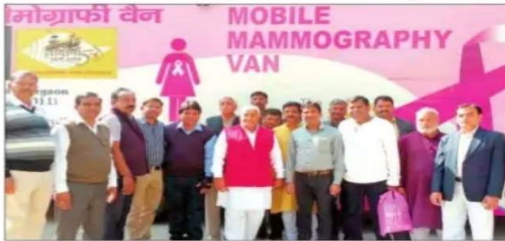
नागरिक अस्पताल में स्तन कैंसर जांच शिविर का शुभारंभ करते विधायक कापड़ीवास।

रेवाड़ी, 20 फरवरी (वधवा): रोटरी क्लब रेवाड़ी मेन एवं सिविल अस्पताल रेवाड़ी के संयुक्त तत्वावधान में मंगलवार को मैमोग्राफी (स्तन कैंसर जांच) शिविर का आयोजन किया गया। जिसका शुभारंभ रेवाड़ी के विधायक रणधीर सिंह कापड़ीवास ने किया। उन्होंने लोगों से अपील की कि वे अपने परिवार की महिलाओं की जांच करवाएं और इस निःशुल्क सेवा का लाभ उठाएं। यह स्तन कैंसर की जांच हर माह की 20 तारीख को की जाएगी। जिसके लिए किसी भी दिन सिविल अस्पताल के महिला विभाग में अथवा डा. विजय प्रकाश से मिलकर अपना रजिस्ट्रेशन करवा सकते हैं। क्योंकि इस मैमोग्राफी वैन की एक दिन में 20 से 25 महिलाओं की जांच करने की क्षमता है। शहर के किसी भी अस्पताल में स्तन कैंसर