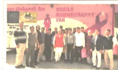
नागरिक अस्पताल में निशुल्क स्तन कैंसर जागरूकता शिविर के शुभारंभ पर उपस्थित विधायक रणधीर सिंह कापड़ीवास ● जागरूक

जागरूक संवाददाता, रेवाड़ी : स्वास्थ्य विभाग और रोटरी क्लब रेवाड़ी मेन के संयुक्त तत्वावधान में नागरिक अस्पताल में मैमोग्राफी (स्तन कैंसर जांच) शिविर का आयोजन किया गया। विधायक रणधीर सिंह कापड़ीवास ने शिविर का उद्घाटन करते हुए क्लब की ओर से दिए गए सहयोग की सराहना की। शिविर में 9 महिलाओं की जांच कर उन्हें उचित परामर्श दिया गया। विधायक रणधीर सिंह कापड़ीवास ने कहा कि इस प्रकार के सहयोग से आम लोगों को महंगा उपचार कगने से पहले होने वाली जांच का खर्च से बचाव हो सकेगा। सस्ती स्वास्थ्य सेवाएं आम आदमी को मिले यह बेहद आवश्यक है। आमतौर पर इसकी जांच में निजी तौर पर कम से कम तीन से चार हजार रुपये का खर्च आता है, नागरिक अस्पताल में हर माह की 20 तारीख को इसको निशुल्क जांच कराई जा सकती है। रोटरी क्लब रेवाड़ी मेन ने सिविल अस्पताल के सहयोग से स्तन कैंसर की जांच हर माह की 20 तारीख को