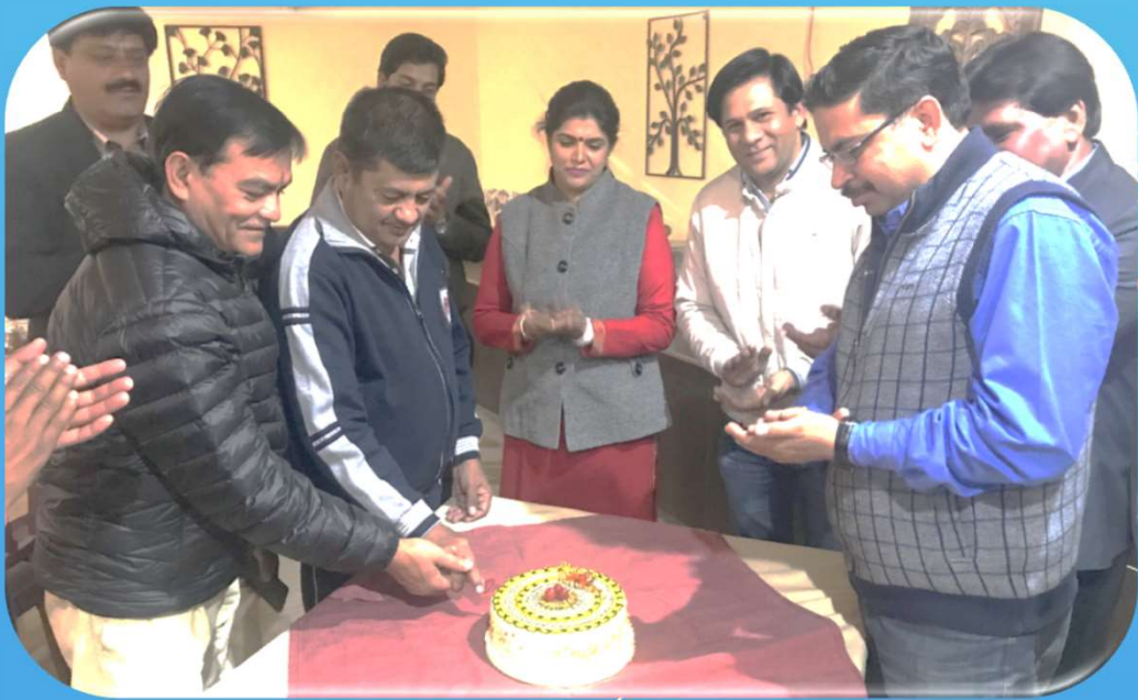
Rotary Day Celebration