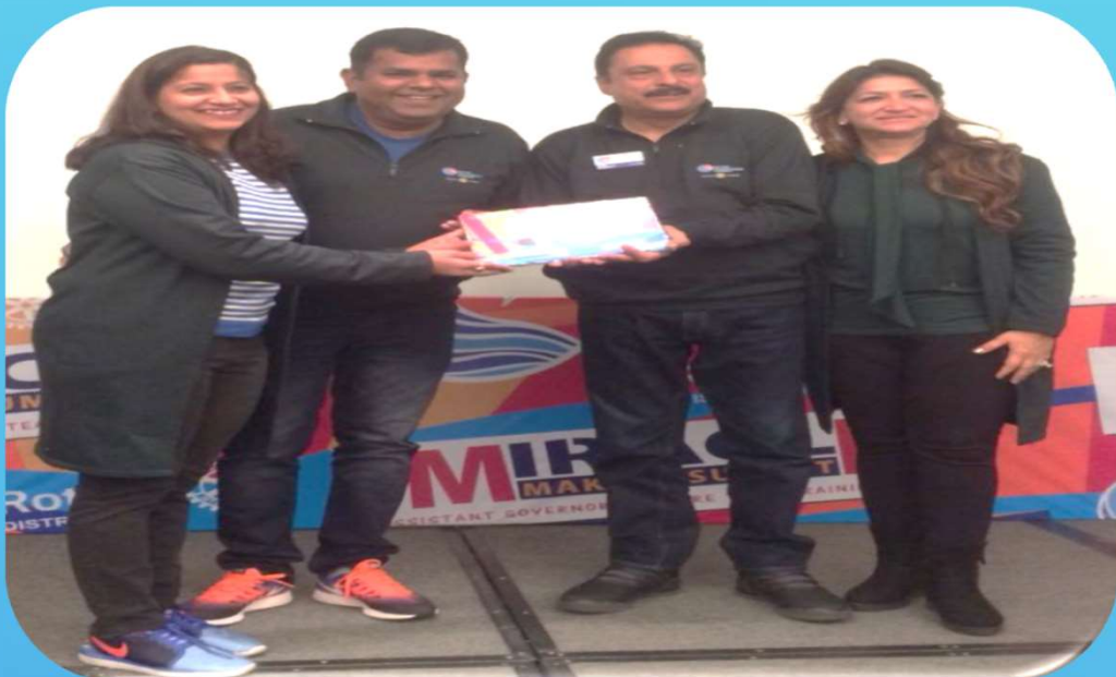
AGTS at Mussoorie, UK